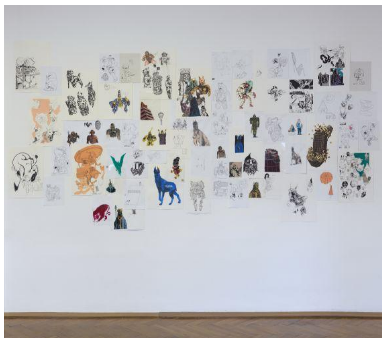
Utrinek z razstave.